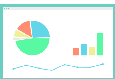
Διάγραμμα Επισκεπτών Ιστοσελίδας/Μήνα